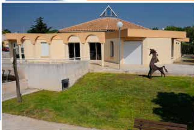
Rue de la Plaine