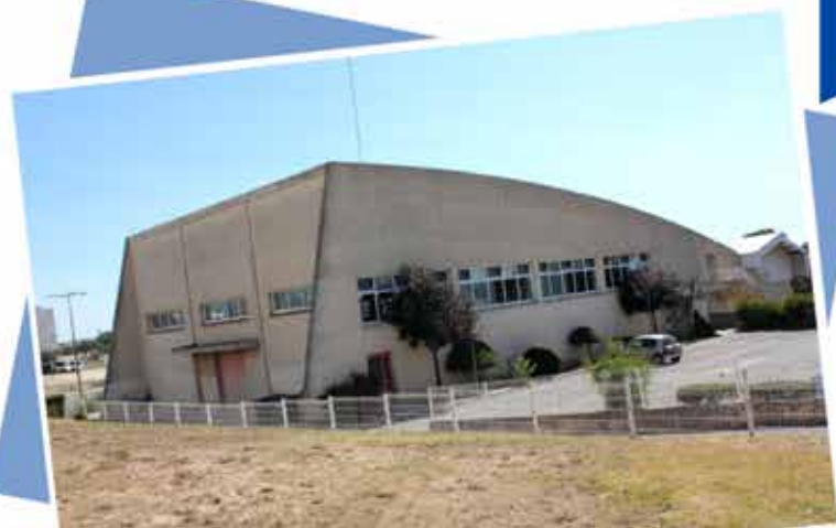
Salle Lionel de Brunélis