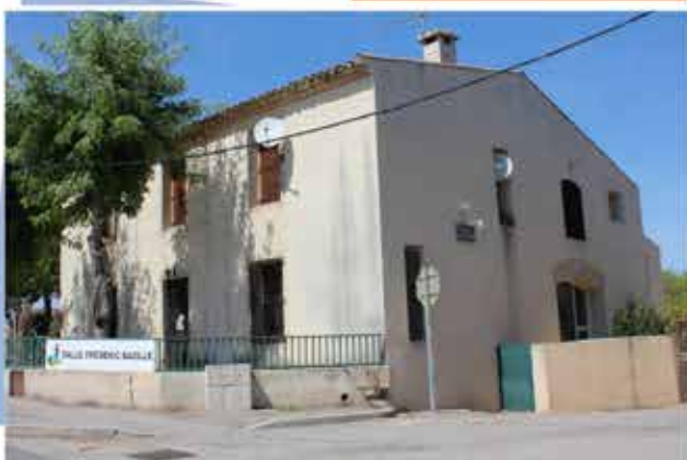
Ancien grand chemin de Montpellier à Lodève