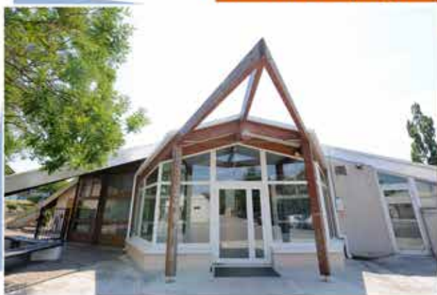
Chemin du grand Chêne Blanc